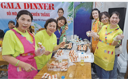
GALA DINNER DŌI MŌI CHIEN THANG Ngày 04 tháng 10 năm 2025