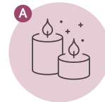
A. 빛 캔들