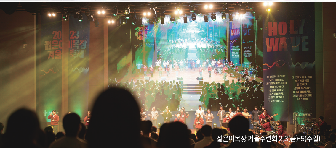
젊은이목장 겨울수련회 2.3(금)-5(주일)

탄생 1994. 1. 9 / 창립 1994. 5. 7 제 30권 1519호 2023년 2월 19일