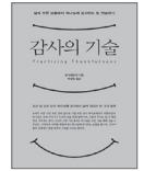
감사의 기술_샘 크램트리