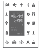
비블리컬 윤리학 양형모