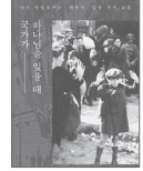
국가가 하나님을 잊을 때_어린 W.후치