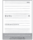
읽는다는 것 강영환